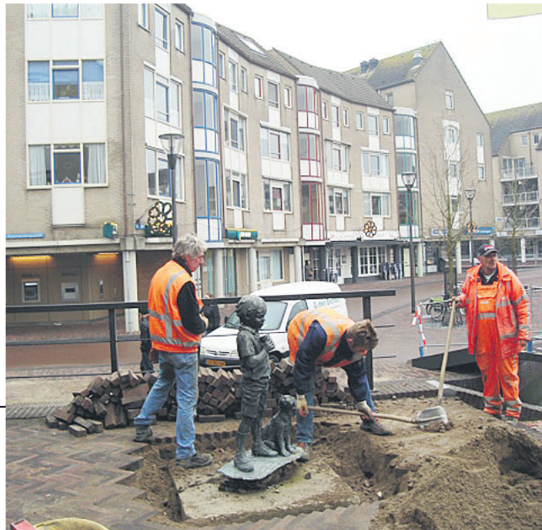
Op 18 december is, mede op aandringen van bewoners bij de gemeente, het beeldje 'jongen met hond' weer op zijn oude plek geplaatst.